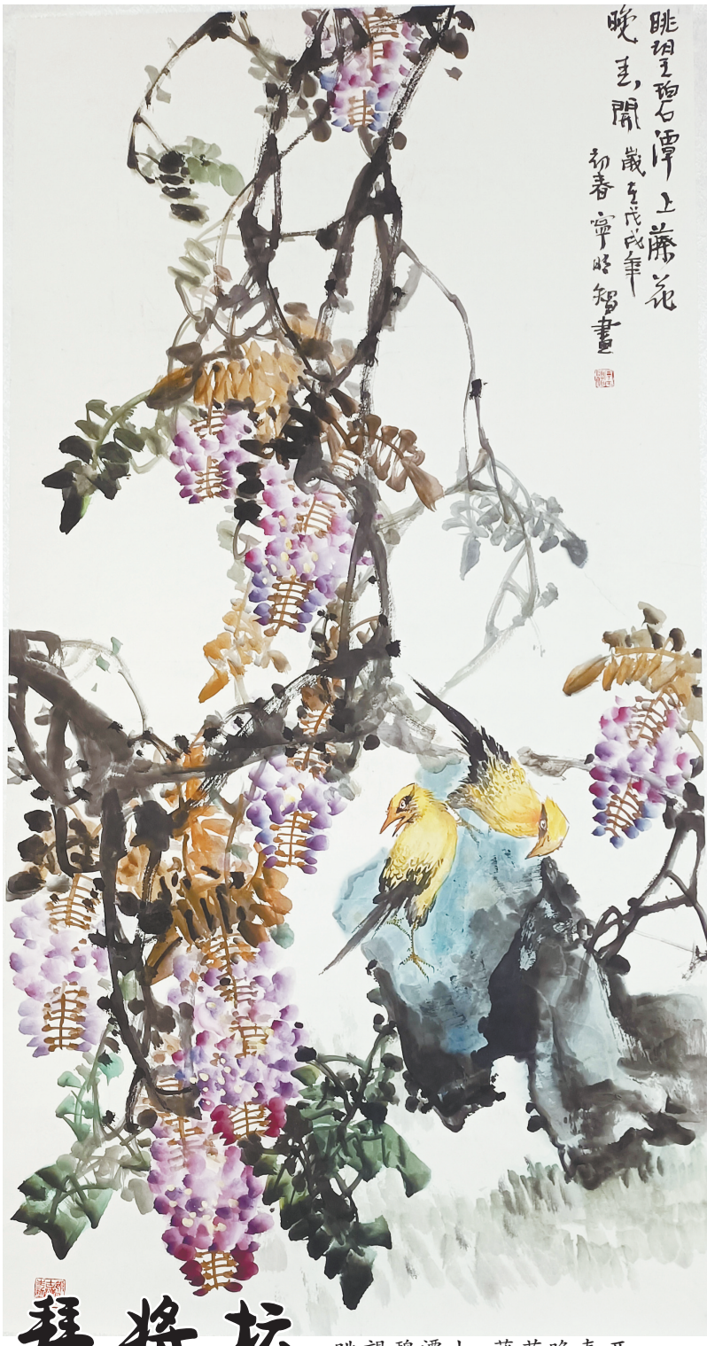
眺望碧潭上 藤花晚春开 宁明智作

此书命名《天汉丰碑》,源于著者将这批建功于世、造福生民的官员,视为“丰碑”式人物。正因为有此认知,作者落笔,满怀激情,思潮奔涌,文字通达快畅,极富感染力。在笔者看来,作者是用手中之笔,来勾勒这一群像,且成功凿刻出一方立于汉中大地的山川的“丰碑”。