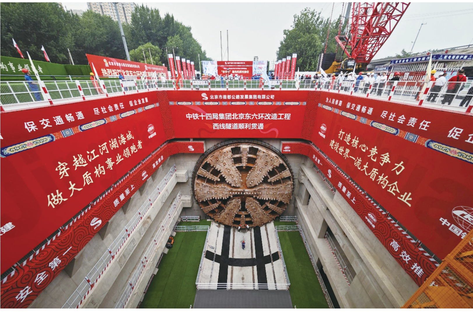
6月28日,国产最大直径盾构机——“京华号”盾构机出洞,由中铁十四局承建的北京东六环改造工程西线隧道顺利贯通。这是目前我国最长盾构高速公路隧道,标志着这一国家级创新工程取得重大进展。

公安部提示广大交通参与者,夏季是出游出行高峰,交通安全时刻牢记在心。驾车出行要严格遵守守法,尽量减少强降雨、台风等恶劣天气期间驾车出行;自觉抵制酒驾醉驾违法犯罪行为;切勿违法超员、超载,不要超速行驶,疲劳驾驶,分心驾驶。乘车出行要乘坐安全合规车辆,务必全程全员系好安全带。