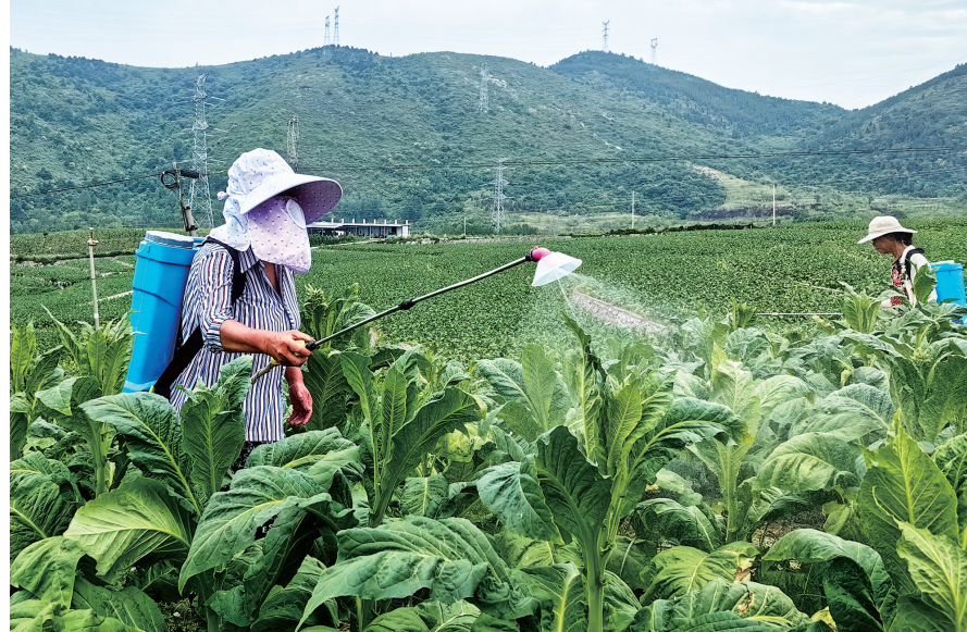
勉县金泉镇东村积极扩大产业致富种类,因地制宜流转荒坡地200亩发展烤烟产业,不断壮大村集体经济,带动农户增收。近期,化学杀菌正在有序进行,有效预防病虫害,确保烟叶稳产增收。

此次活动的开展,进一步强化了村民的防范意识,构筑起坚实的思想防线,有效提高了群众对电信诈骗的防范、鉴别和自我保护能力,为建设平安和谐美丽圣水贡献了力量。