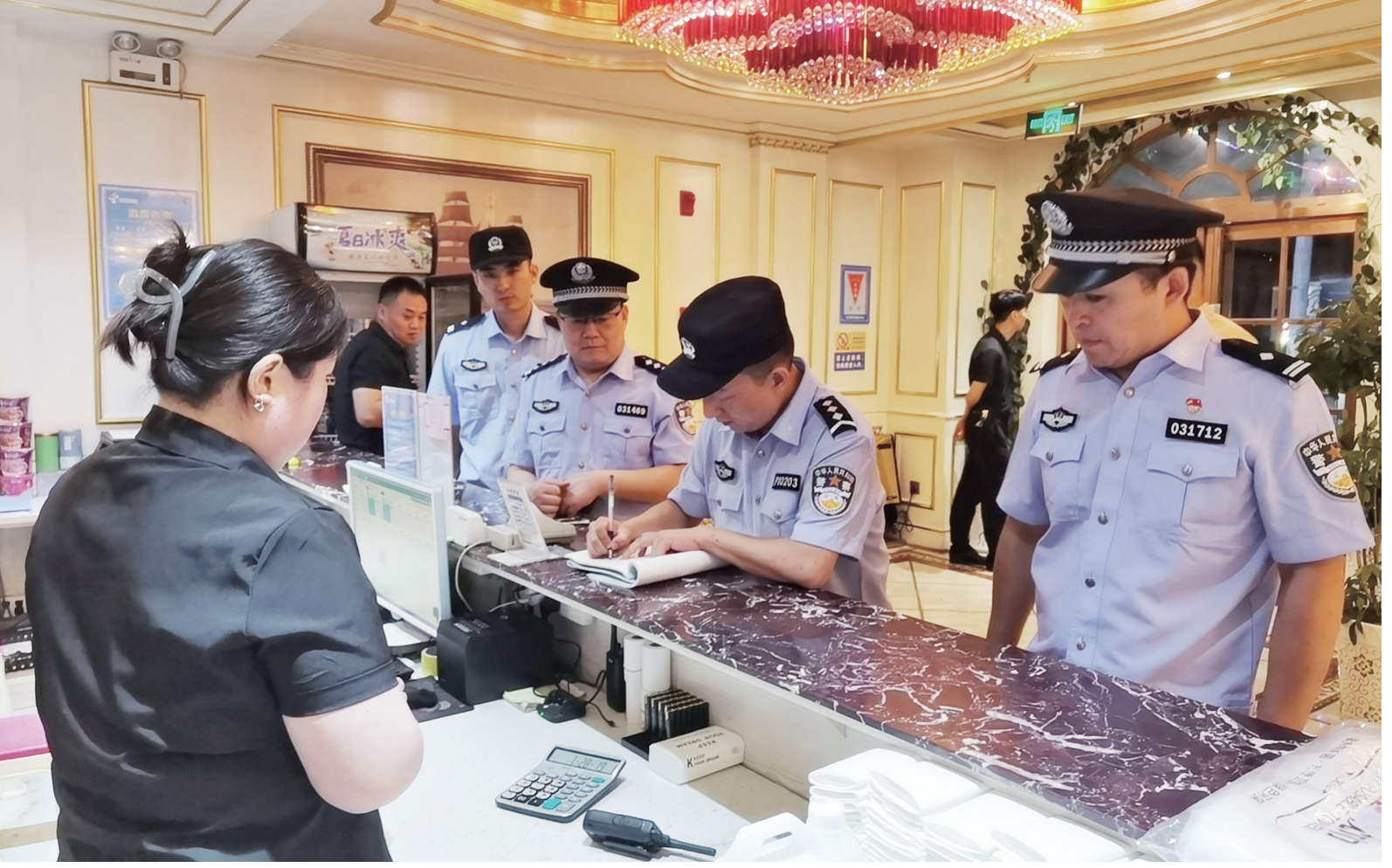
近日,我市公安机关在全市范围内开展夏夜治安巡查宣防集中统一行动,对治安重点部位、场所、路段开展清查整治。行动共出动警力3122人次,检查车辆2664台次,抓获违法犯罪嫌疑人36人、在逃人员5人,破获刑事案件6起,刑事拘留12人。