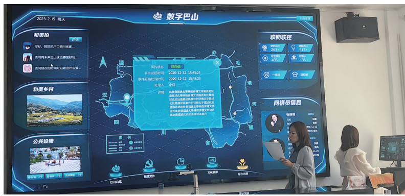
工作人员在调试数字巴山管理系统。