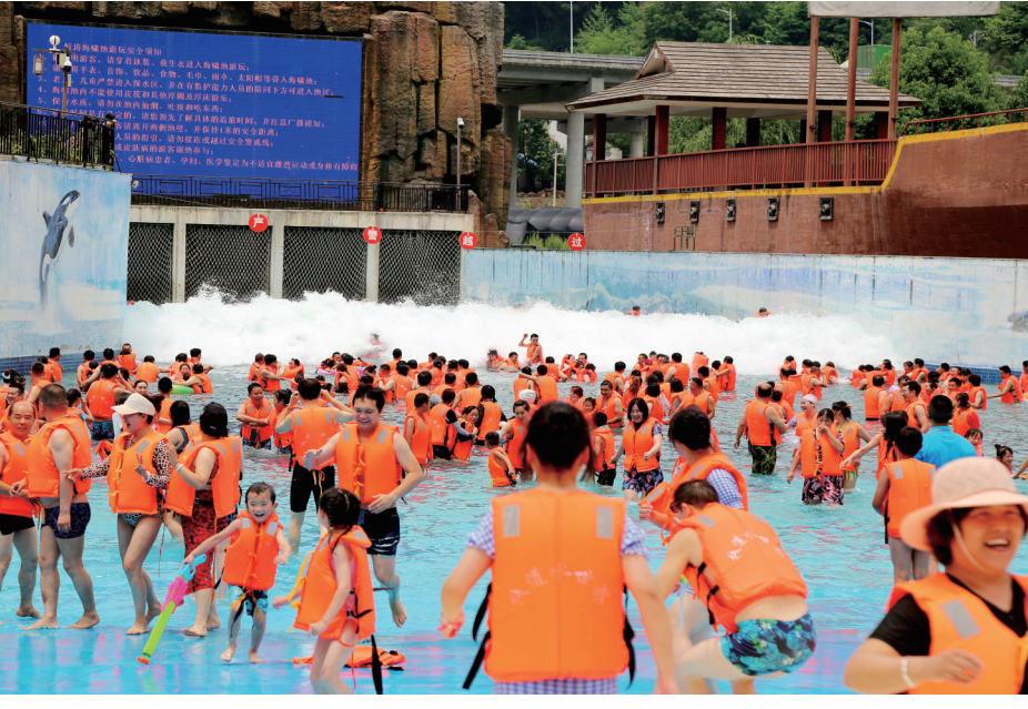
留坝“中国栈道水世界”惊涛海啸池项目吸引了众多游客打卡。