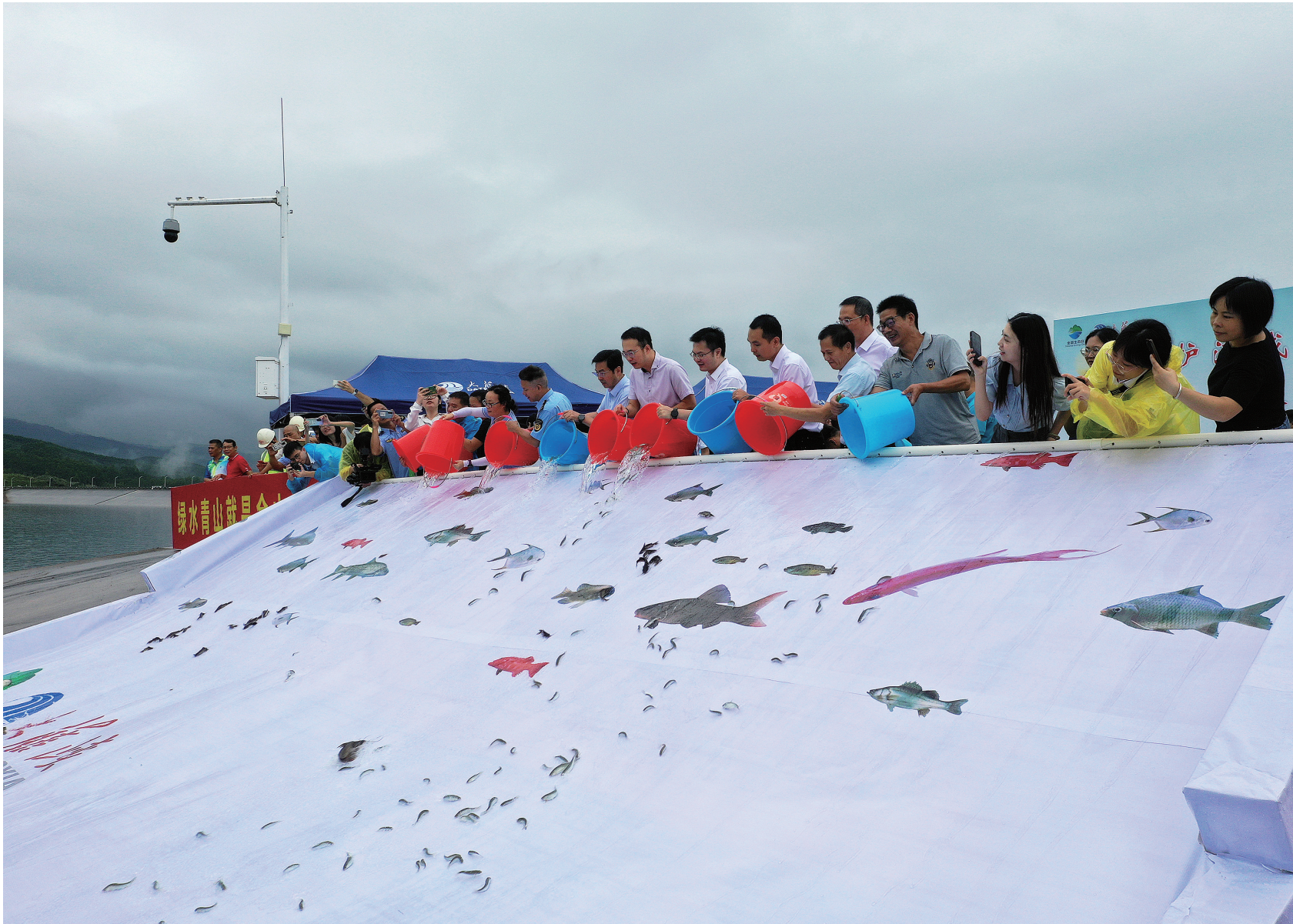
8月15日,广西大藤峡水利枢纽工程组织增殖放流活动,迎接首个全国生态日。据介绍,本次共放流各类珍稀、濒危、经济鱼类160多万尾。图为当日,在广西大藤峡水利枢纽工程,工作人员在放流鱼苗(无人机照片)。新华社记者 曹祥铭 摄

商务部等9部门联合印发的《县域商业三年行动计划(2023-2025年)》8月14日对外发布。计划提出,到2025年,在全国打造一批县域商业“领跑县”,90%的县达到“基本型”及以上商业功能,具备条件的地区基本实现村村通快递。新华社发 徐晓作