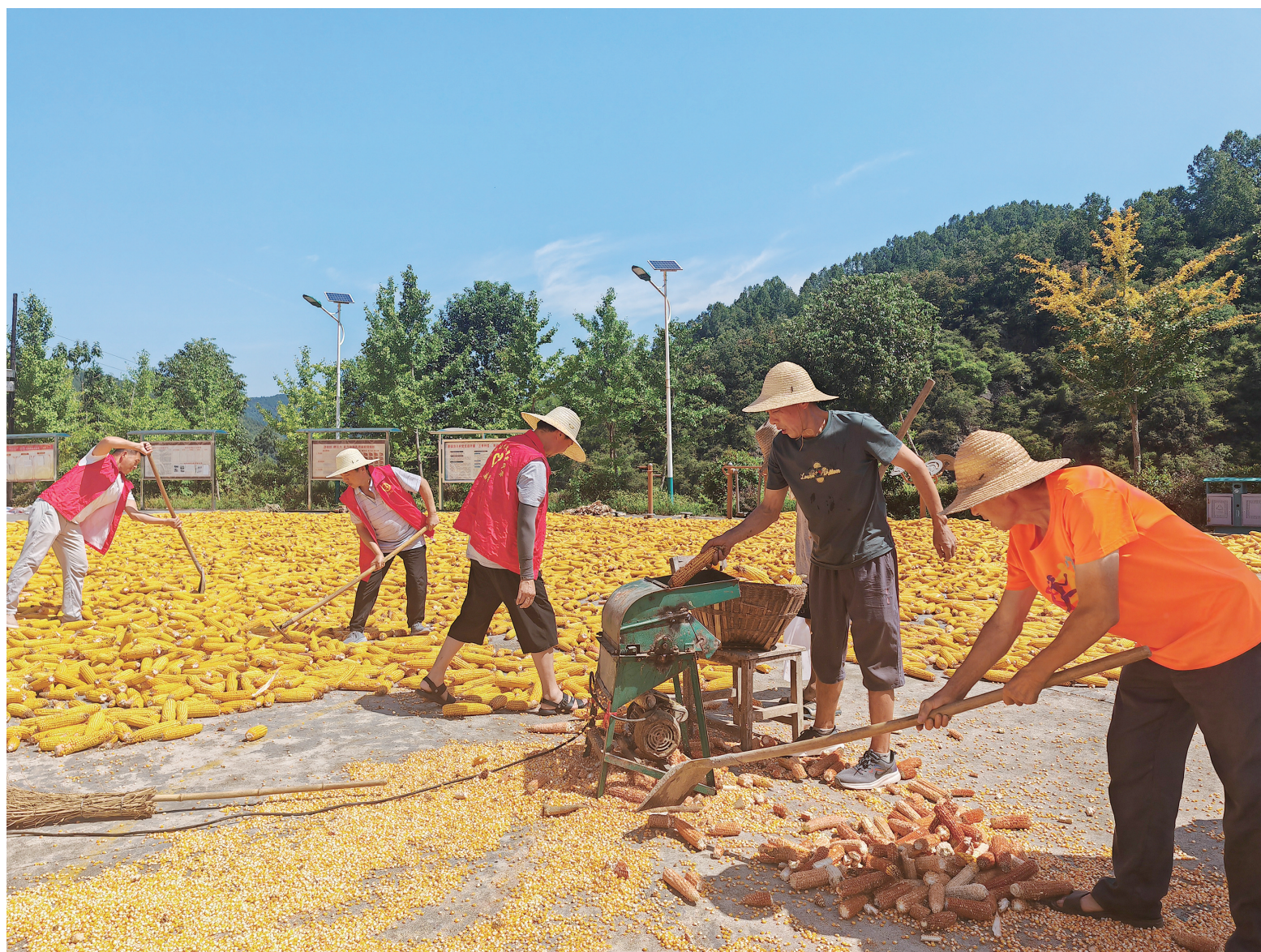
今年,西乡县茶镇渔丰村利用花椒园空隙地种植玉米,并喜获丰收。近日,当地千群对收获的玉米进行晾晒脱粒。

在活动结束时,恰逢洋县政协工商联界别委员工作室人员集中到双亚集团文创园开展调研活动。面对开镰节的火热场面,委员们建议,把“开镰节”打造为赋能公司产业升级的新一轮增长点,聚焦发展观光农业直播经济,建设农耕风情民俗园,开办洋县黑米美食美食节,让洋县黑米走上世界人民的餐桌。