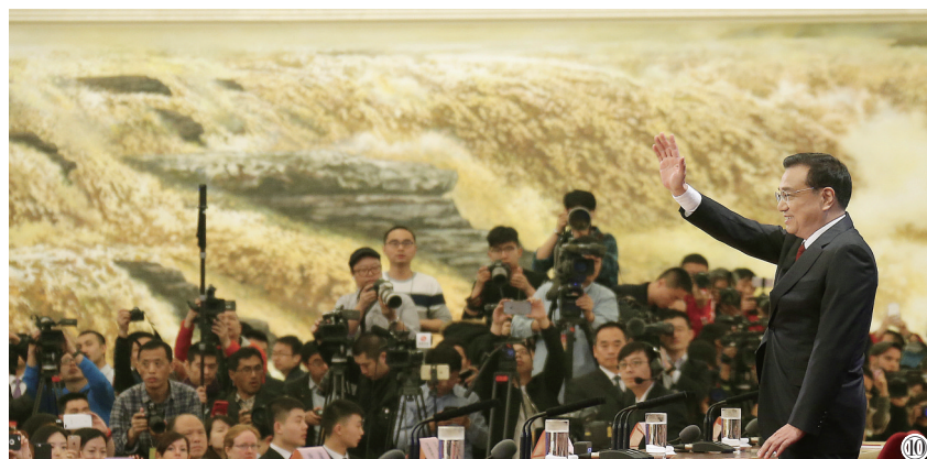
图⑩:2016年3月16日,李克强同志在北京人民大会堂与中外记者见面,并回答记者提问。