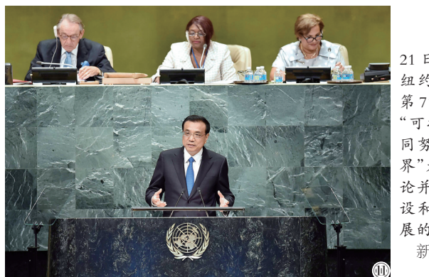
图⑪:2016年9月21日,李克强同志在纽约联合国总部出席第71届联合国大会以“可持续发展目标:共同努力改造我们的世界”为主题的一般性辩论并发表题为《携手建设和平稳定可持续发展的世界》的讲话。