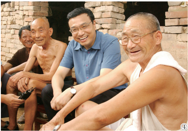
图④:2003年8月8日,李克强同志在河南省新乡市调研。这是李克强同志在原阳县桥北乡原庄村与村民亲切交谈。