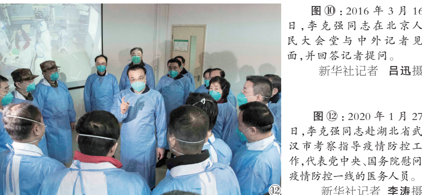
图⑫:2020年1月27日,李克强同志赴湖北省武汉市考察指导疫情防控工作,代表党中央、国务院慰问疫情防控一线的医务人员。