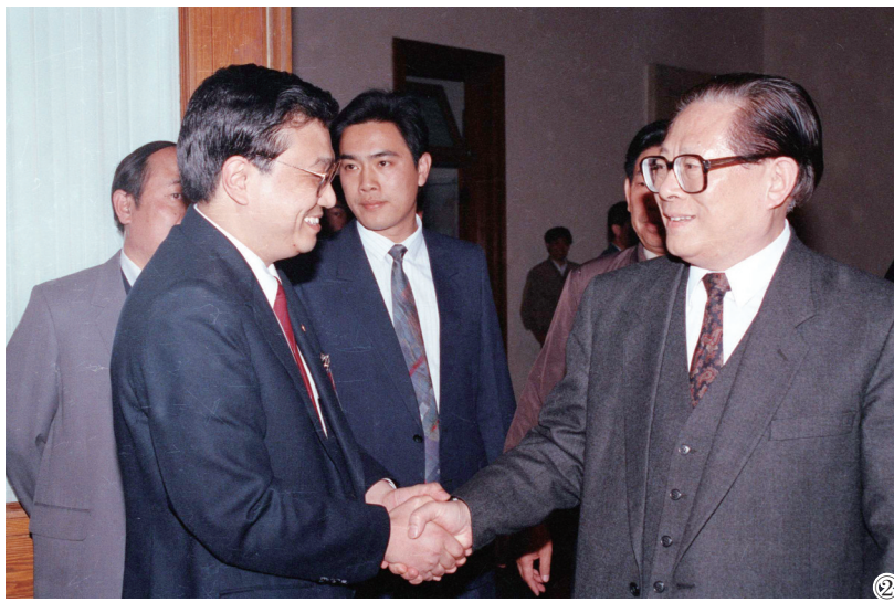
图②:1993年5月3日下午,中国共产主义青年团第十三次全国代表大会在北京人民大会堂开幕。在5月3日上午的预备会议后,举行第一次主席团会议,推选李克强等同志为主席团常务主席。这是江泽民同志与李克强同志握手。