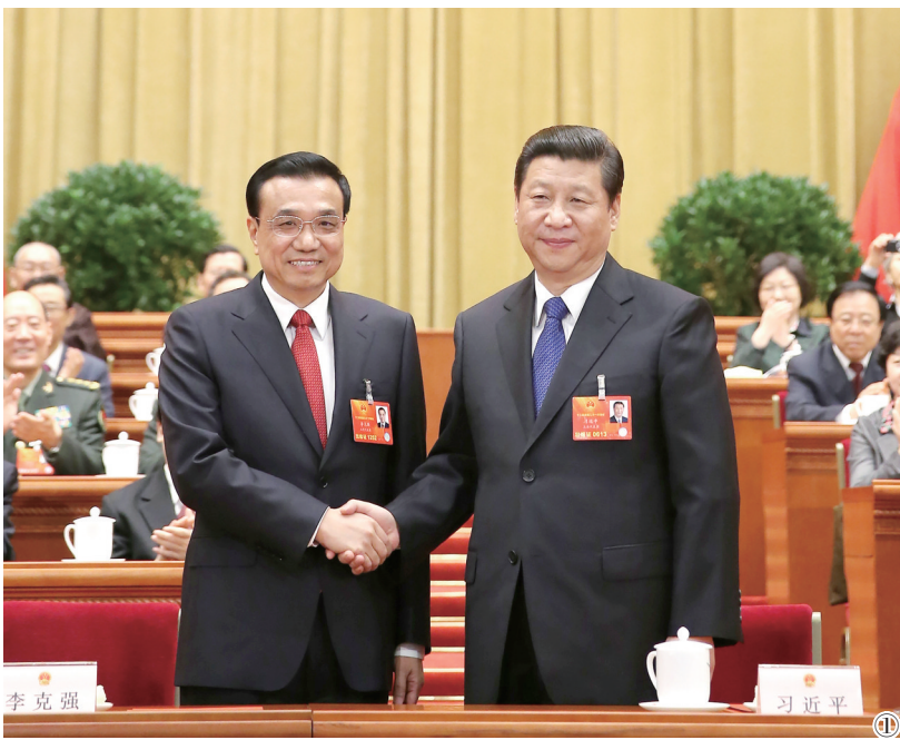
图①:2013年3月15日,第十二届全国人民代表大会第一次会议在北京人民大会堂举行第五次全体会议。会议经过投票表决,决定李克强为中华人民共和国国务院总理。这是习近平同志和李克强同志亲切握手。