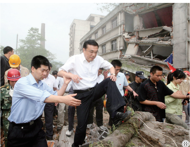
图⑧:2008年5月19日,李克强同志在四川地震灾区察看灾情。

中国共产党的优秀党员,久经考验的忠诚的共产主义战士,杰出的无产阶级革命家、政治家,党和国家的卓越领导人,中国共产党第十七届、十八届、十九届中央政治局常委,国务院原总理李克强同志,因突发心脏病,经全力抢救无效,于2023年10月27日0时10分在上海逝世,享年68岁。