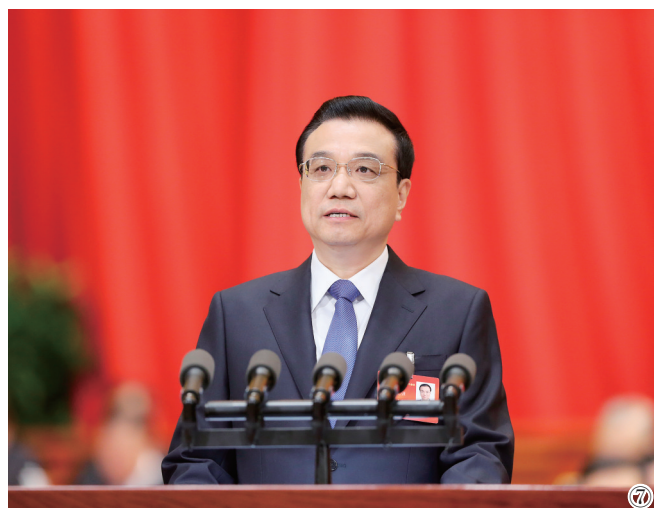
图⑦:2014年3月5日,第十二届全国人民代表大会第二次会议在北京人民大会堂开幕。李克强同志作政府工作报告。