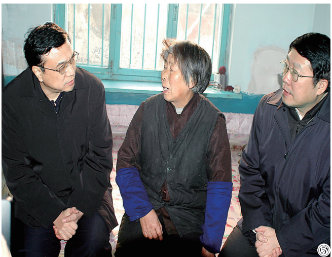
图⑤:2004年12月26日,李克强同志到辽宁省抚顺市莫地沟棚户区居民王淑贞家中走访调研。