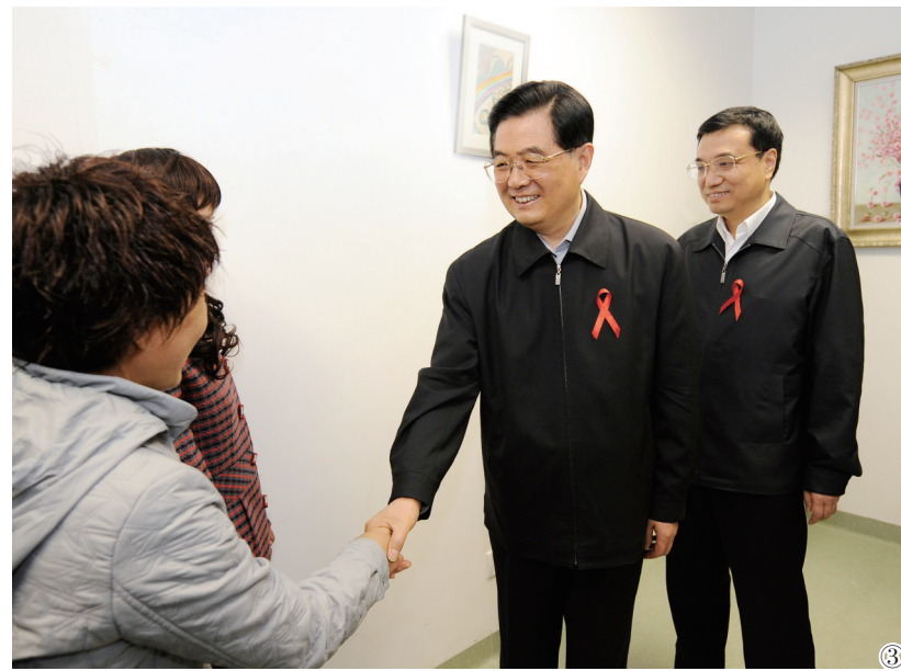
图③:2008年12月1日是第21个世界艾滋病日。胡锦涛同志和李克强同志来到北京地坛医院考察艾滋病防治工作。