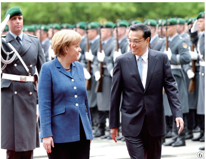
图⑥:2013年5月26日,李克强同志在柏林出席德国总理默克尔举行的欢迎仪式。