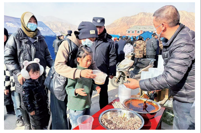
12月18日23时59分,甘肃省临夏州积石山县发生6.2级地震。这是12月19日,在积石山县大河家镇大河村安置点,受灾群众排队取餐。