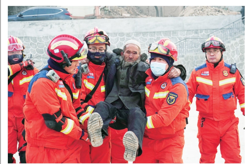
12月18日23时59分,甘肃省临夏州积石山县发生6.2级地震。这是12月19日,在积石山县大河家镇大河村,消防人员开展救援。