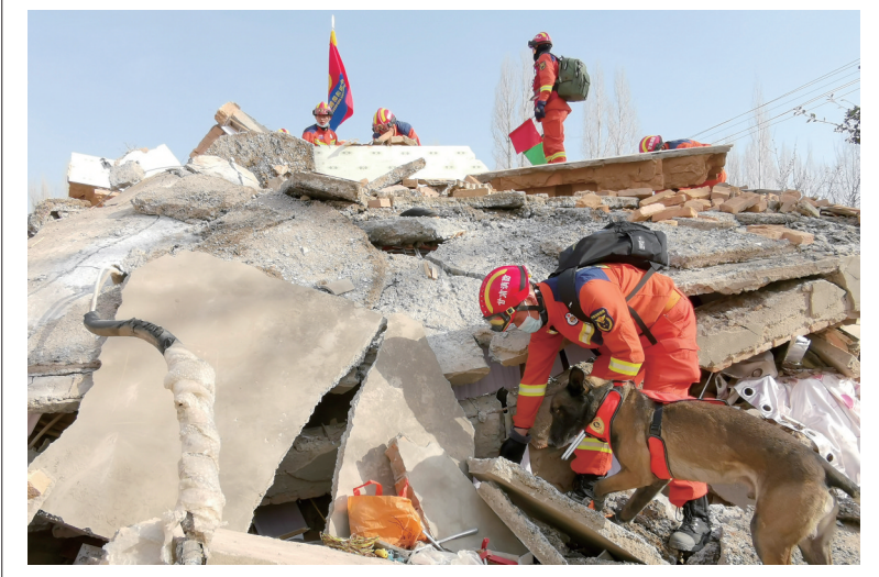
12月18日23时59分,甘肃省临夏州积石山县发生6.2级地震。这是12月19日,救援人员在积石山县大河家镇进行救援。