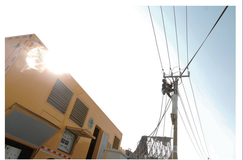
12月18日23时59分,甘肃省临夏州积石山县发生6.2级地震。这是12月19日,在积石山县大河家镇大河村安置点,电力部门工作人员抢修电力设施。