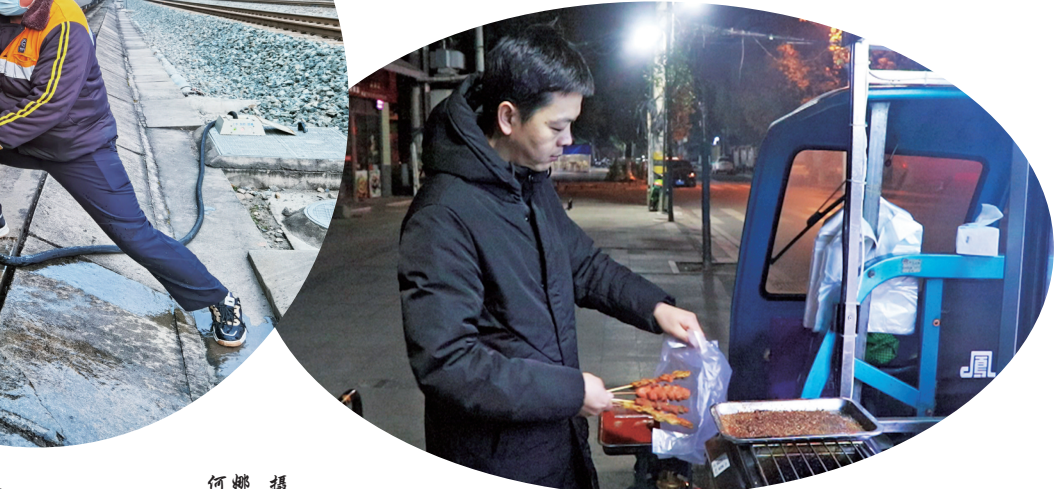
刘师傅将顾客的烧烤装袋。