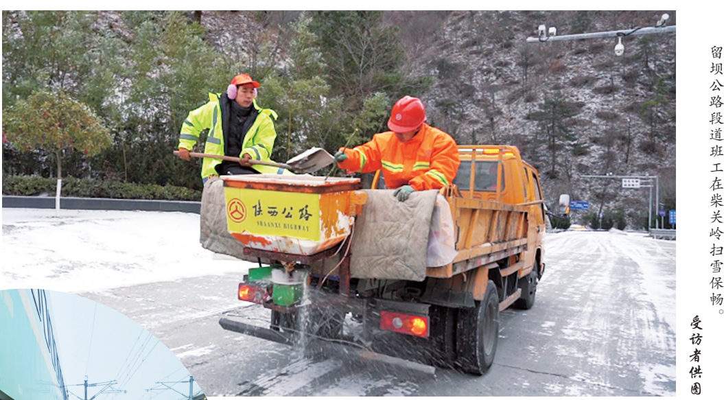
留坝公路段道班工人在柴关岭扫雪保畅。