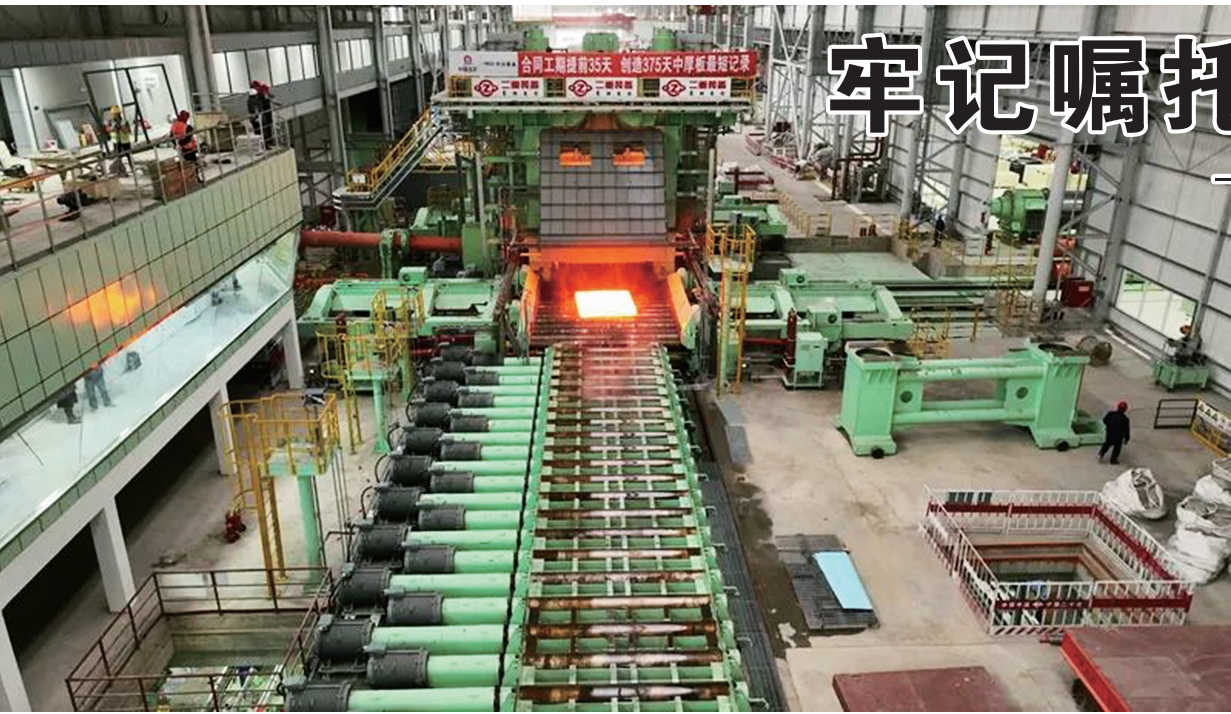
陕钢中厚板项目投产现场。

万里征程风正劲，千钧重任再扬帆。新的一年，全市发展改革系统将聚焦经济建设中心工作，坚持稳中求进、以进促稳、先立后破，以更加奋进的姿态和昂扬斗志，为努力建设环境优美、绿色低碳、宜居宜游的生态城市目标凝聚更多发力点！