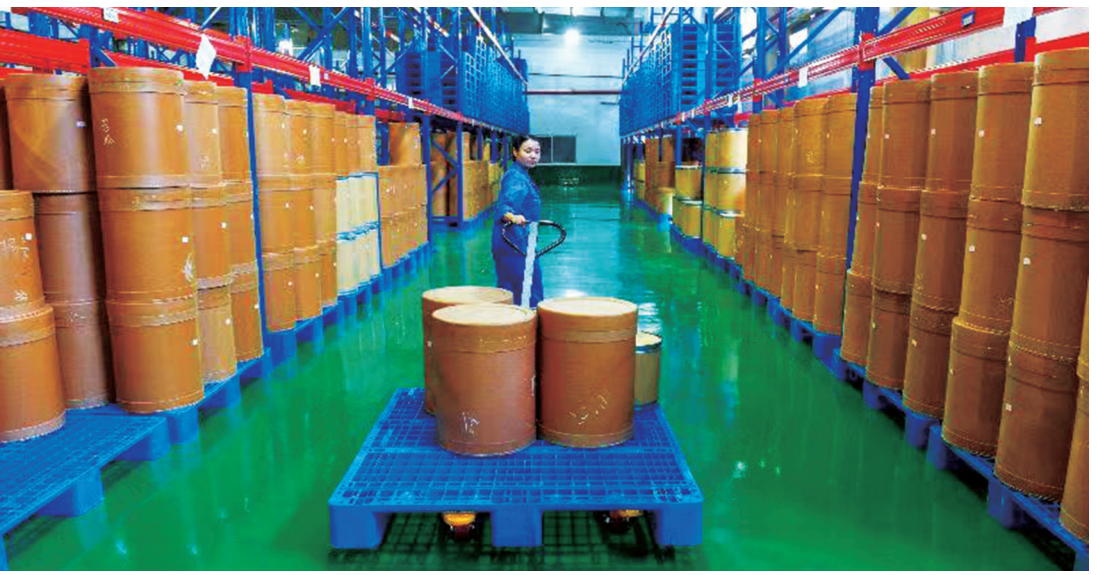
陕西白云药厂生产车间。