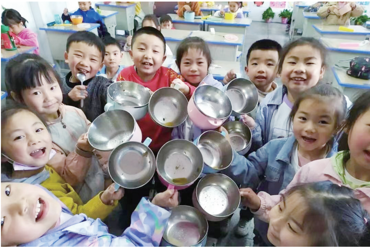
宁强北关小学的学生积极践行光盘行动,珍惜每一粒粮食。