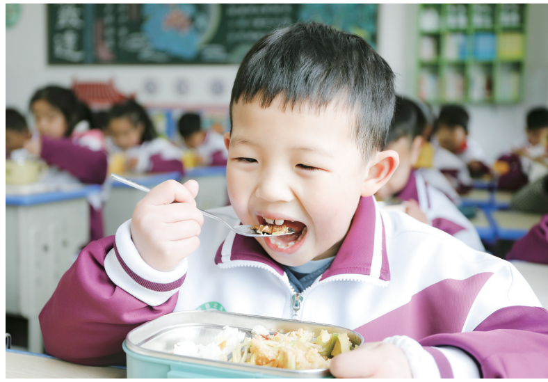
宁强北关小学的学生在学校开心享用午餐。

受限于场地和经费等因素,2023年秋季学期,九里岗小学在充分征求家委会及家长意见的前提下,因地制宜将德育展室、教师值班室、音乐室等5个功能场室设置为学生午休室,先后在午休室安装了窗帘、空调、油汀等设备,购置了午休折叠床,营造良好午休环境。“趴睡”变“躺睡”,真正让学