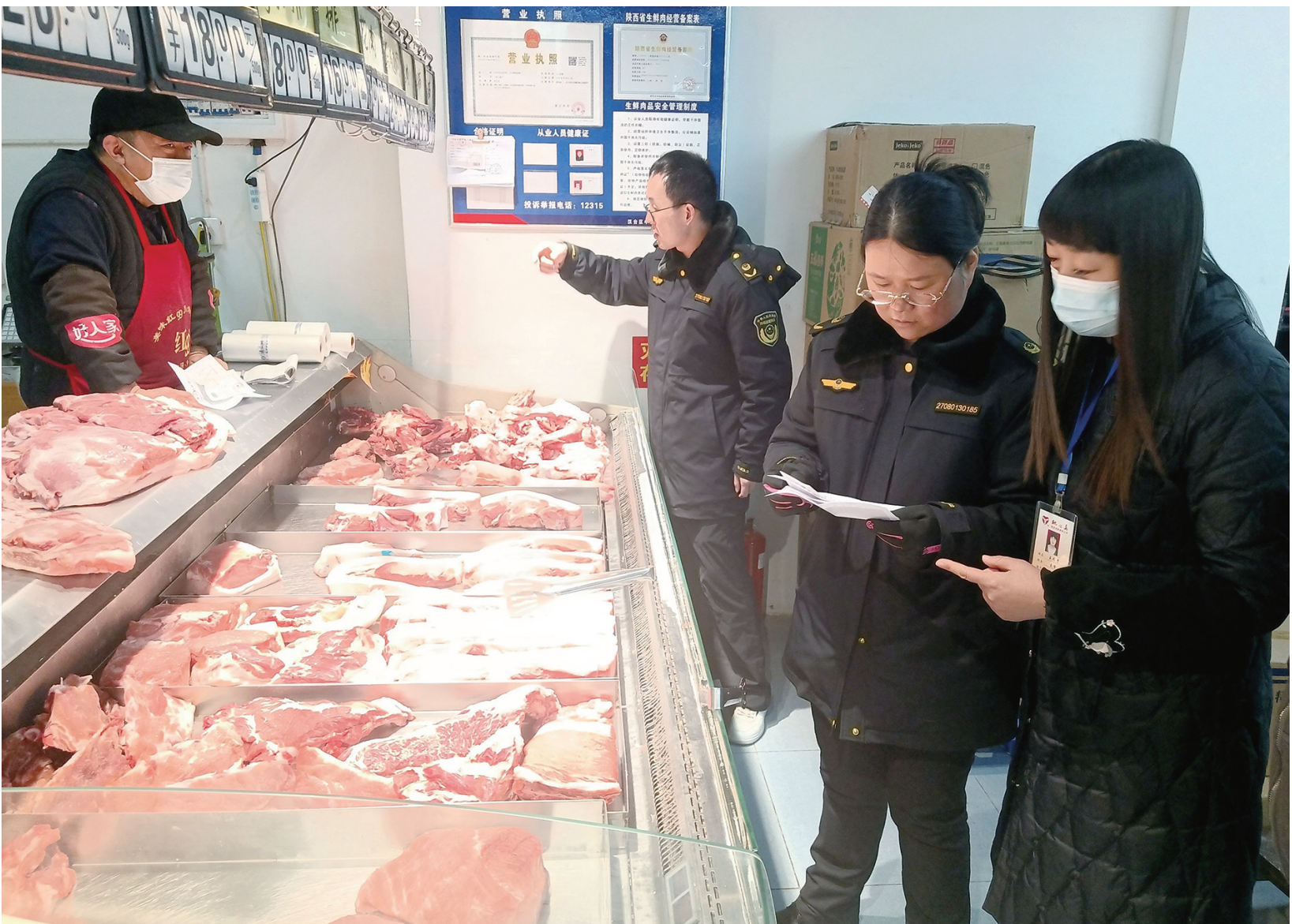
近日,汉台区市场监管人员对辖区生鲜肉市场进行专项检查,详细了解经营者的进货来源、索证索票、明码标价等情况,确保辖区食品安全。

(上接第1版)他们不仅全力挖掘、保护和传承宁强羌漆相关技艺,还进行了大胆创新。 “我们将现代时尚元素融入到漆器中去,同时还把漆器与金属、玻璃等材料进行跨界结合。老技艺加上新元素,能够让它绽放出新魅力。”熊永磊希望宁强漆器能走进更多人的生活视野里。 一滴漆,百里千刀觅得自然馈赠。一件器,千琢万磨追求人间至美。蛰伏三年,宁强漆器与这群热爱之人共同开启了新的“漆”彩时光。 2021年,生漆采集技艺、髹漆技