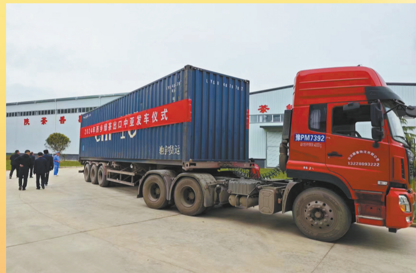
2024年4月16日,西乡县举行2024年西乡茶叶出口中亚仪式,60吨茶叶运往乌兹别克斯坦首都塔什干。