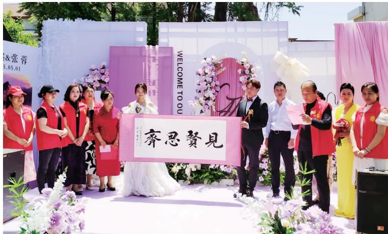
在安巷村新时代文明实践站负责人的主持下,新人郑重接过“见贤思齐”家风横幅。